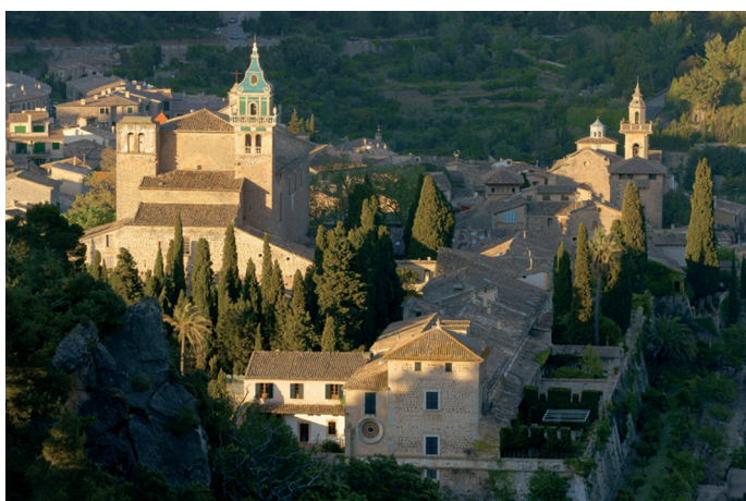
Fig. 6. Cartoixa i església parroquial.

ma definitiva per anar a desembocar en l'obra, feixuga però mestrívola del campanar de la parròquia de Santa Maria del Camí. 48