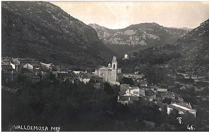
Fig. 3. Valldemossa Mallorca. Tarjeta postal Truyol, Palma, c. 1920.

de l'església de Sant Joan Baptista de Muro, que l'arquitecte projectà el 1862. 35