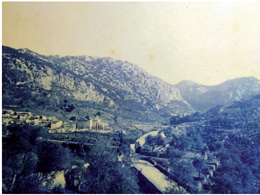
Fig. 2. Valldemossa. Fons fotogràfic de la Biblioteca Lluís Alemany, Palma, Inici segle XX.

rístics de l'arquitecte com la sobrietat, la geometria o els frontons triangulars, que llavors utilitzaria a Valldemossa.