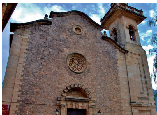
Fig. 4. Esglésies parroquials El Terreno i Valldemossa, projectes de 1924.

El projecte de l'arquitecte Forteza estava inspirat en el campanar de Cartoixa. El rector de la parròquia va agafar un mestre que vivia a Palma. Vaig fer un dibuix tamany natural del contorn del coronament i el mestre va fer un motlle. D'una sola cara, i aquest coronament està fus, de ciment, no picat, com la part de baix, que és d'obra. 40