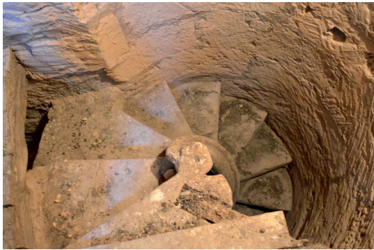
Fig. 1. Escala del campanar, 1566.

Baltasar de Borja ordenà iniciar les obres, que no es dugueren a terme fins a 1638 i 1639, quan amb la decoració de les claus de la nau es donaren per acabades. 19 Just després, la visita pastoral del bisbe fra Joan de Santander el 1641 reflecteix com el temple seguia comptant amb sis capelles, un cor i una sagristia que es renovaria anys després, el 1669. 20