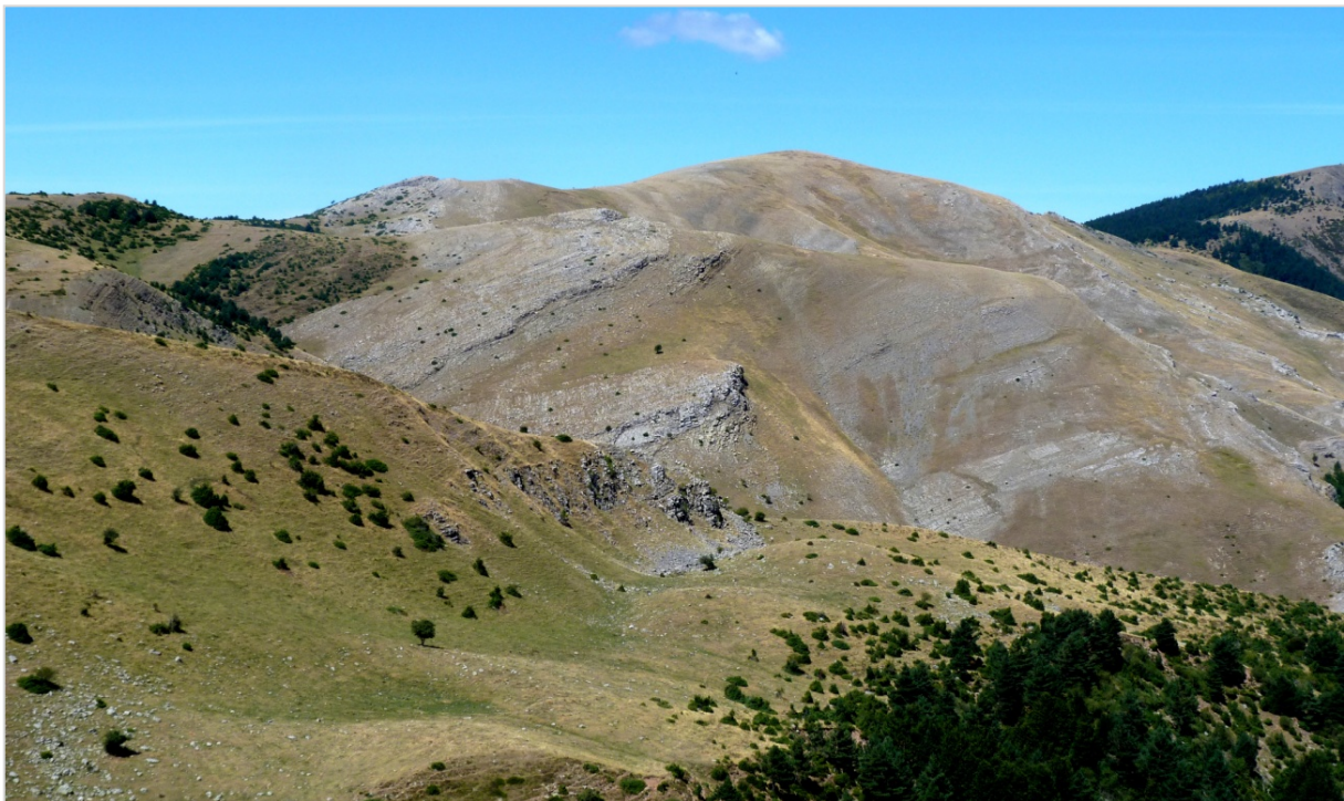
Fig. 8. Las formas redondeadas y con escasa karstificación superficial que se aprecian en la mole carbonatada de la vertiente riojana del cordal de Cantincao y Arobe son un ejemplo de las pocas posibilidades que esta franja de montañas calizas, que cruza toda la umbria de Urbión desde Neila hasta Cameros, ofrece a la supervivencia de poblaciones de Dryopteris mindshelkensis . Es por eso que resulta altamente significativa su presencia aquí, en un contexto geográfico tan alejado de la Cordillera Cantabro-Pirenaica y tan enormemente distante de las poblaciones del sur peninsular. Mucho más asombrosa, si se considera la insistente presión ganadera a la que se les ha sometido durante siglos a estos “cabezos” y los vaivenes climáticos y procesos de largas sequías que soportaron. Solamente si se tiene muy en cuenta la extraordinaria especialización que caracteriza y explica el éxito de la especie en el conjunto de su área euroasiática, y su longevidad individual—superior a la influencia de varias generaciones de pastores— permitiría aproximarse, con la humildad que conviene al sabio, a una mínima y honesta interacción en favor de su supervivencia.