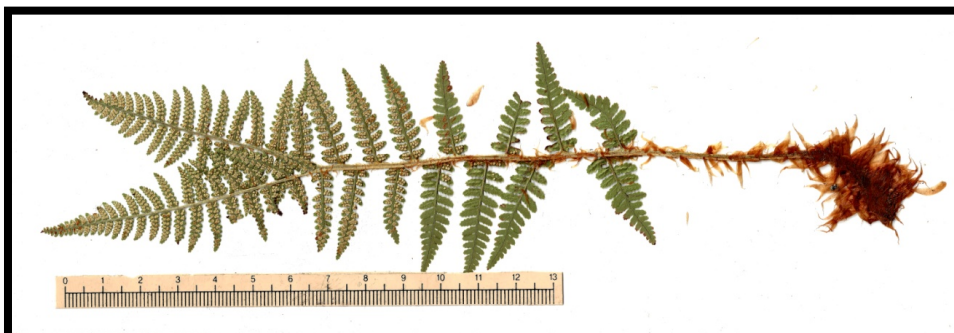
Fig. 12. Fronde enana, con soros en toda la parte media superior. Procede del pliego ALEJ 471/11.