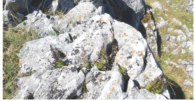
Fig. 5. Dos aspectos de la misma población de Dryopteris mindshelkensis probablemente formada originariamente por un solo individuo, con rizomas que aparecen por las grietas de un tramo de cresta rocosa muy karstificada. Hacia la orientación N, aunque también les afecta el rigor del sol estival, las frondas, a mediados de agosto, aún conservan el color, y tal vez la capacidad de producir todavía algunas esporas viables.