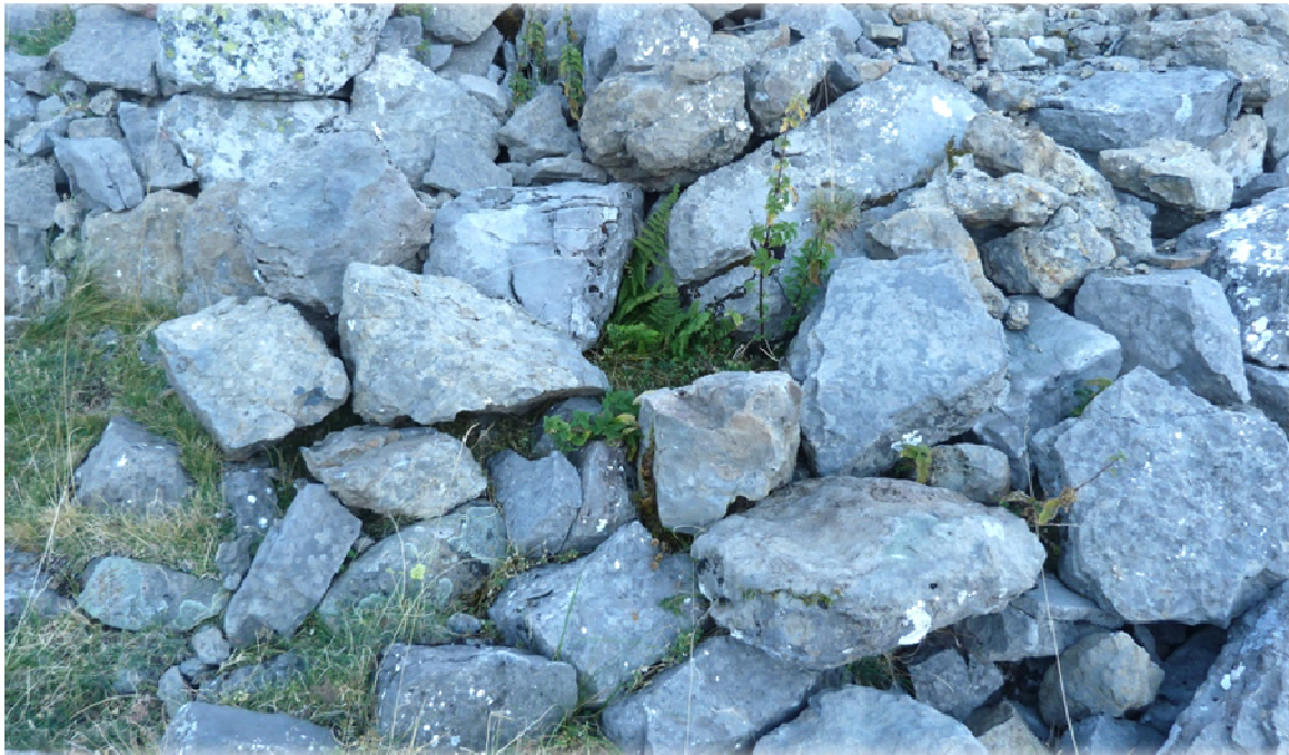
Fig. 4. Tras una mirada distraída, nadie diría que estos bloques permanecen desde un lejano “ayer” en el borde de la pedrera y al lado de los restos de una vieja construcción pastoril. Merece la pena observar y advertir detalles, pues la Dryopteris minshelkensis que parece refugiarse en el centro, como en el fondo de una cesta, es una de las seis o siete que conforman una pequeña población aislada, a cientos de metros de otra no menos reléctica que ella.