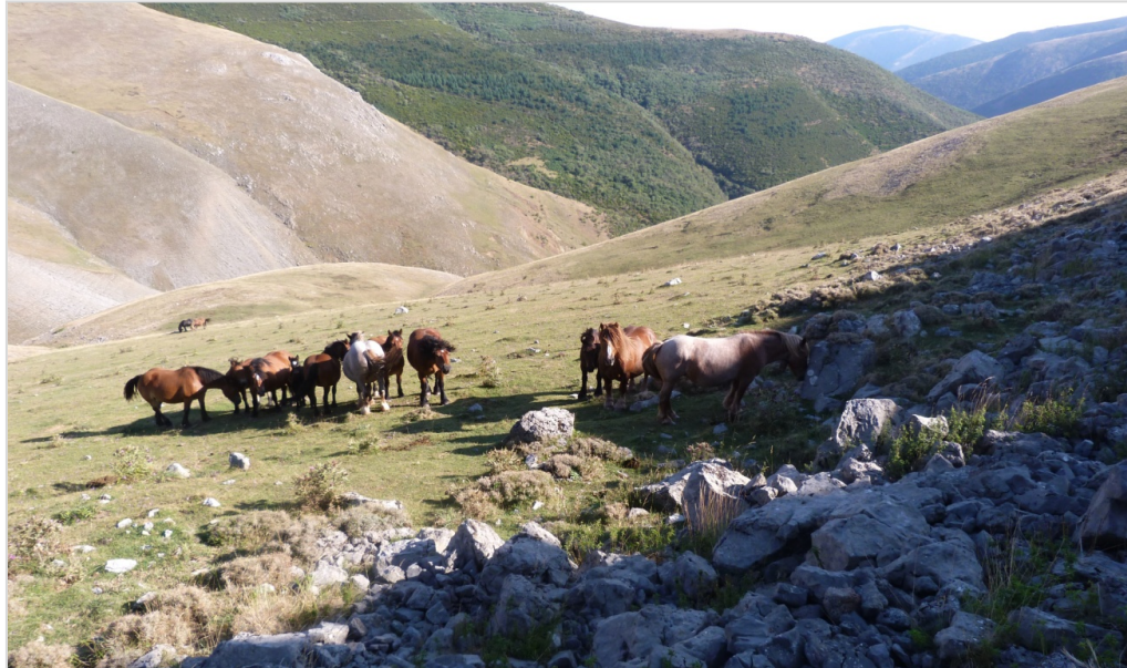
Fig. 1. Una familia de caballos descansa a media sombra y se entretiene momentáneamente husmeando entre los bloques del borde inferior de una pedrera, a menos de 5 metros de una casi extinta población de Dryopteris mindshelkensis . Ni interacción ni ignorancia culpable. Supervivencia y muerte de dos atareados seres en aparente libertad absoluta, que se cruzan al margen de la voluntad del hombre.

(Recibido el 18-III-2021) (Aceptado el 31-III-2021)