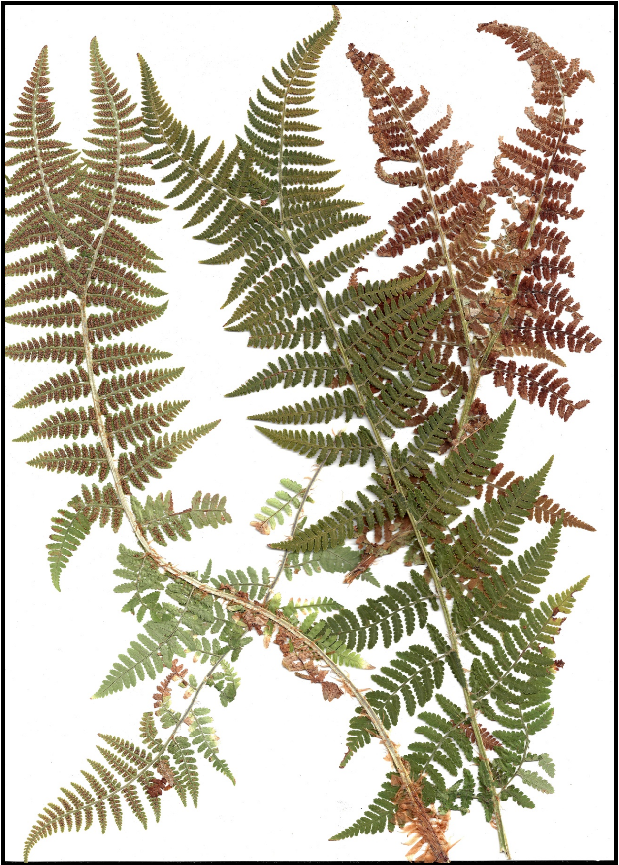
Fig. 9. Composición de tres frondas entresacadas del pliego ALE J 166/20. De Viniegra de Abajo (Lo). Todas proceden de una macolla que tenía varias frondas con lamina ahorquillada, En el ejemplar de la parte superior izquierda se aprecia una formación densa de soros bien dearrollados, que alcanza el ápice de las dos ramas de la horquilla. El ejemplar de la esquina inferior izquierda procede otra macolla probablemente del mismo individuo.