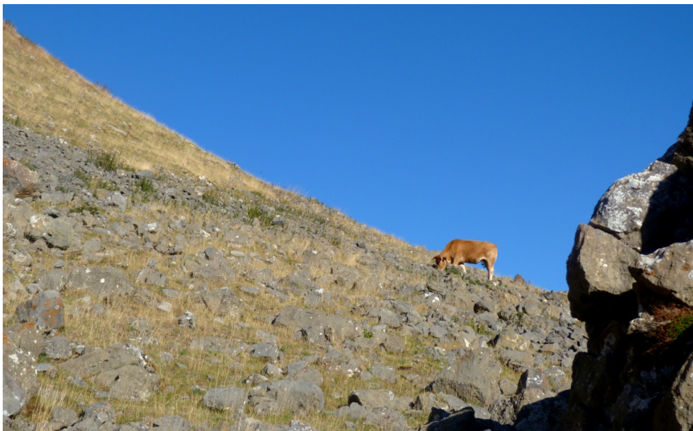
Fig. 2. El paso meditabundo de las vacas resulta más útil que el nervioso de los equinos a la hora de adentrarse de vez en cuando en la pedrera a mordisquear aquí y allá entre los bloques. No es cosa de mala suerte, sino una necesidad, que de vez en cuando el helecho tropiece con la lengua áspera del animal o se oponga al sonido de su pezuña.