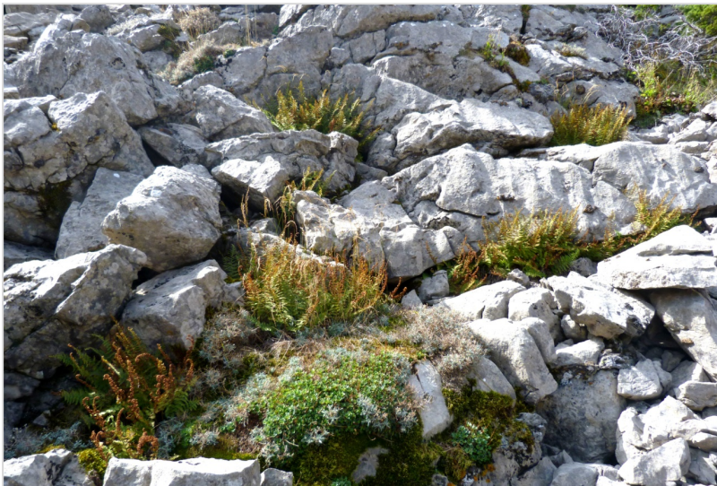
Fig. 6. En poblaciones como la de Neila, se pueden contar centenares de macollas, que en ocasiones aceptan la protección de los ancianos individuos del enebro abierto, y en otras asoman al final de los ramosos rizomas por cualquier grieta de los litosuelos intensamente karstificados y relativamente escasos de vegetación. En ambas situaciones, es prácticamente imposible llegar a separar los individuos. Según el nivel de luminosidad y la intensidad de la radiación solar directa que les afecta, el desarrollo de las frondas puede llegar a ser muy diverso: en tamaño, desde exuberante a extremadamente reducido; y en lo que respecta a la supervivencia hasta la llegada de heladas, pueden entrar en crisis antes de esporular o permanecer de un verde intenso casi hasta las primeras nieves.