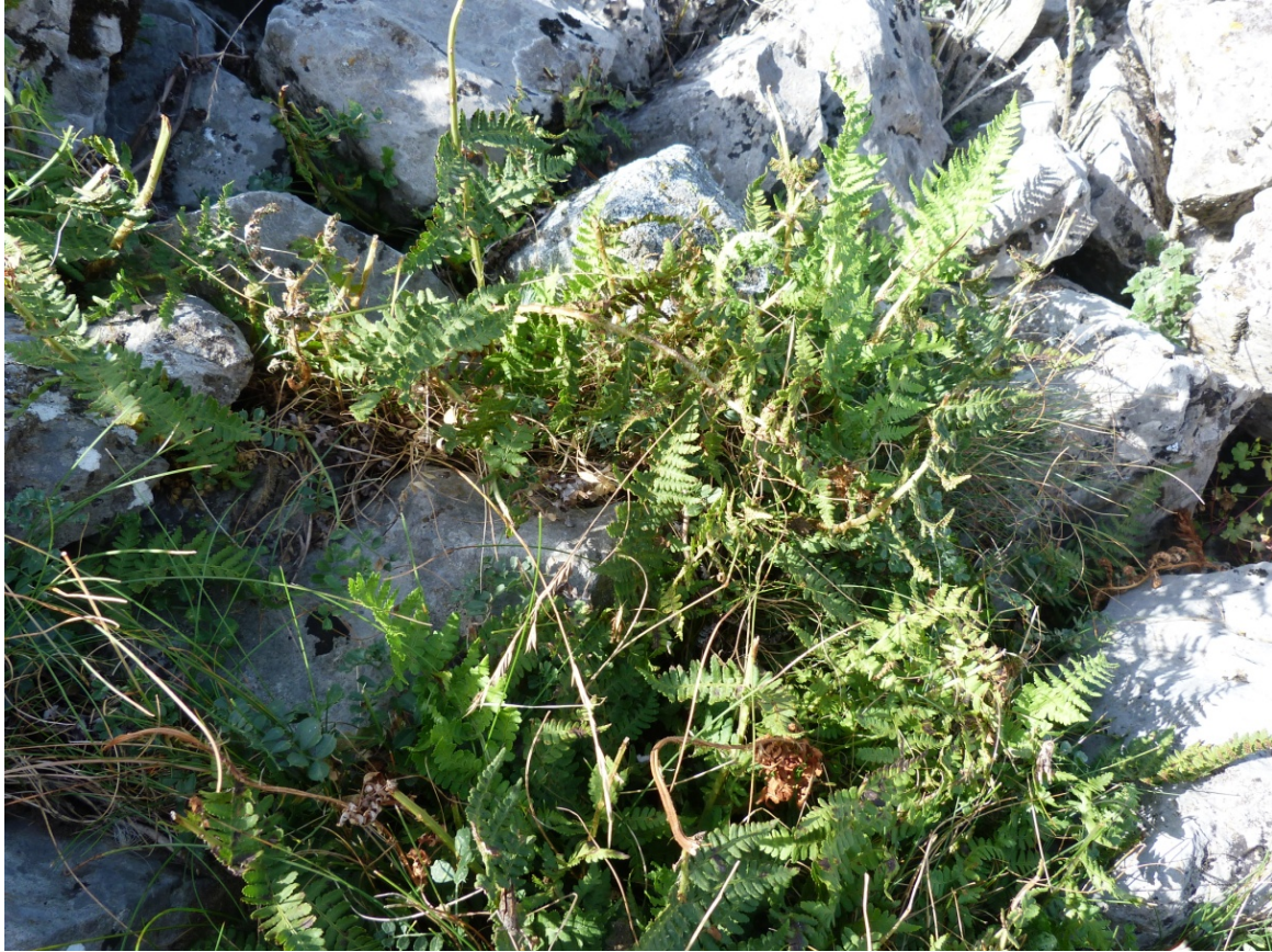
Fig. 3. Material jugoso, al parecer, ya que lo mordisquea el ganado (vacas y caballos). Frondas pequeñas probablemente del único individuo que conforma una de las poblaciones riojanas, conocida desde el 8 de julio de 1991 y fotografiada el 7 de agosto de 2020; claro ejemplo de la longevidad que se le atribuye a esta especie, que sobrevive alargando y diversificando su rizoma entre los bloques de las pedreras y las grietas de los lapiares.