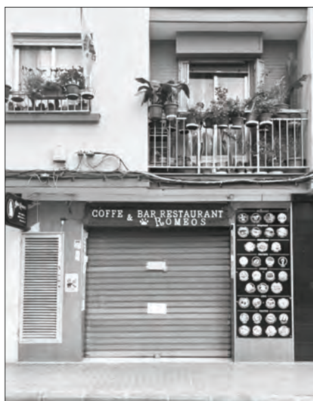
Local d'oci nocturn per als turistes.

Per tant, com hem vist, aquesta estratègia de política urbana segueix les línies de Hausmann (Harvey, 2012) perquè pretén recrear la ciutat per tal d'atraure turistes (Sequera, 2020) mitjançant la modificació i la vulneració del dret a la ciutat (Harvey, 2008), l'expulsió dels residents (Moreno et al. , 2022) o la vulneració dels seus hàbits de vida sense aquest impacte del turisme de masses. Al costat del procés de gentrificació i d'unes polítiques públiques urbanes que van contra el mateix dret a la ciutat (Harvey, 2008), fa un replantejament a favor de la massificació turística que a l'hora de gestionar el reclam turístic el reorienta cap a la seua comoditat (Klein, 2018) fent que se senta «turista» el propi local i, alhora, acomodant com a local el turista, un fet que el moviment veïnal de Cabanyal es negarà a acceptar com veurem més endavant.