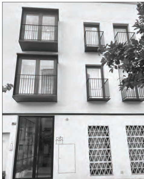
Nova edificació d'oferta d'apartaments turístics.