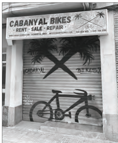
Lloguer de bicicletes orientat a turistes.