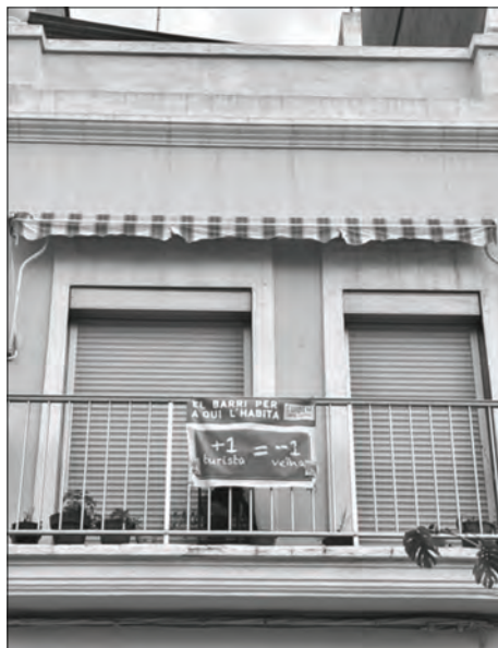
Cartell de reivindicació del veïnat en contra de la turistificació.