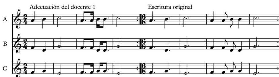
Figura 2. Introducción de “La Pincoya”

ocupo Mi Menor, Sol Mayor, La Menor etc. Melodías con acompañamientos en tonalidades súper sencillas”.