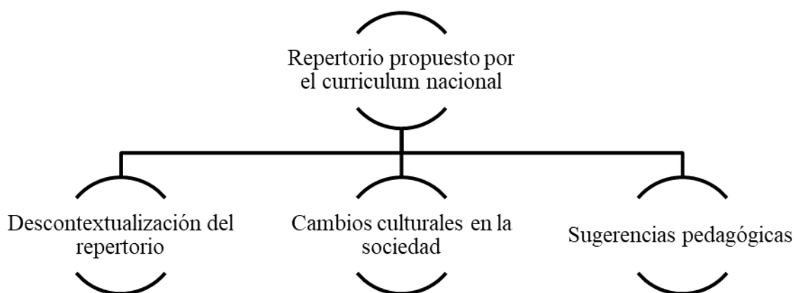
Figura 1. Códigos abiertos de la primera categoría conceptual Fuente: Elaboración propia

No obstante, cabe señalar que a pesar de que el profesorado no toma en consideración el repertorio propuesto en el currículo nacional, sí utiliza la política educativa para dar lineamientos generales al trabajo docente en el aula (Figura 1). En concreto, el Docente 1 señaló que “cuando uno lee el propósito de cada unidad, entiende para dónde debe uno dirigir el trabajo, más que mirar los objetivos de aprendizaje, porque los objetivos de aprendizaje se van repitiendo durante cada unidad”. Entonces, no es que el currículo nacional quede completamente desplazado, sino que son rescatadas otras sugerencias. Por ejemplo, el Docente 2 indica que ha “tomado las pautas de evaluación, rúbricas y todo eso que es impecable”.