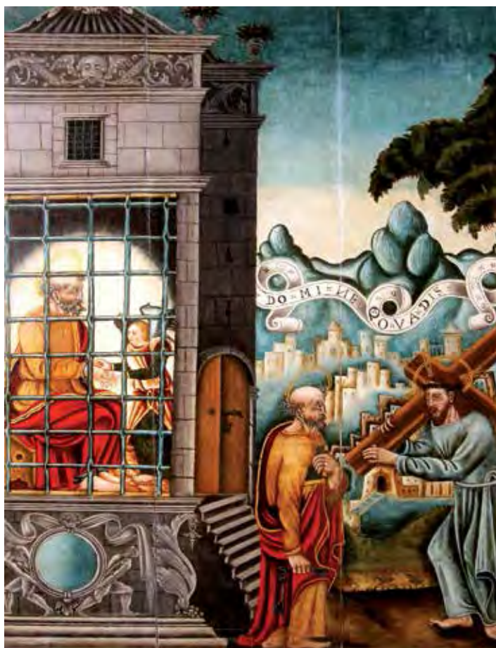
Fig. 3.- Anònim. Alliberament de Sant Pere i Quo Vadis (ca. 1550). Museu de la Col·legiata de Xàtiva.

tejar que procedís del retaule de dita capella (a pesar d'existir altres altars en la Seu, com el dels Lligams de Sant Pere, patronat dels Ferran, que pogueren allotjar-la) i, inclús, tractar de vincular-la a la mà d'Utiel.