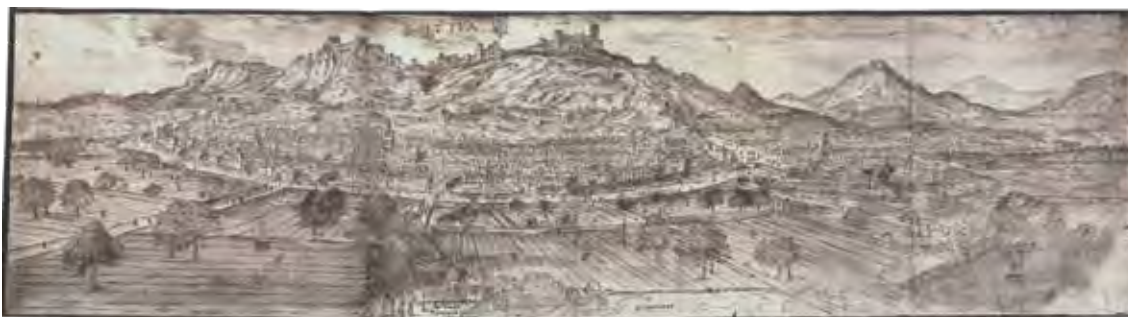
Fig. 1.- Vista de la façana nord de la ciutat de Xàtiva en 1563, dibuixada per Anthoine van den Wyngaerde i conservada a l'Österreichische Nationalbibliothek de Viena, on s'aprecia la gran extensió que presentava a mitjans del segle XVI.

i 1540. En els anys posteriors a la recessió cinc-centista s'adverteixen importants encomanes de produccions escultòriques i pictòriques, i ja des d'aquests anys la ciutat acollí alguns tallers que abastien la important demarcació territorial de la seua sots-governació. Malauradament, la innegable efervescència artística viscuda en Xàtiva durant la segona meitat del segle no té un reflex material efectiu: les obres conservades corresponents a aquesta cronologia són molt escasses.