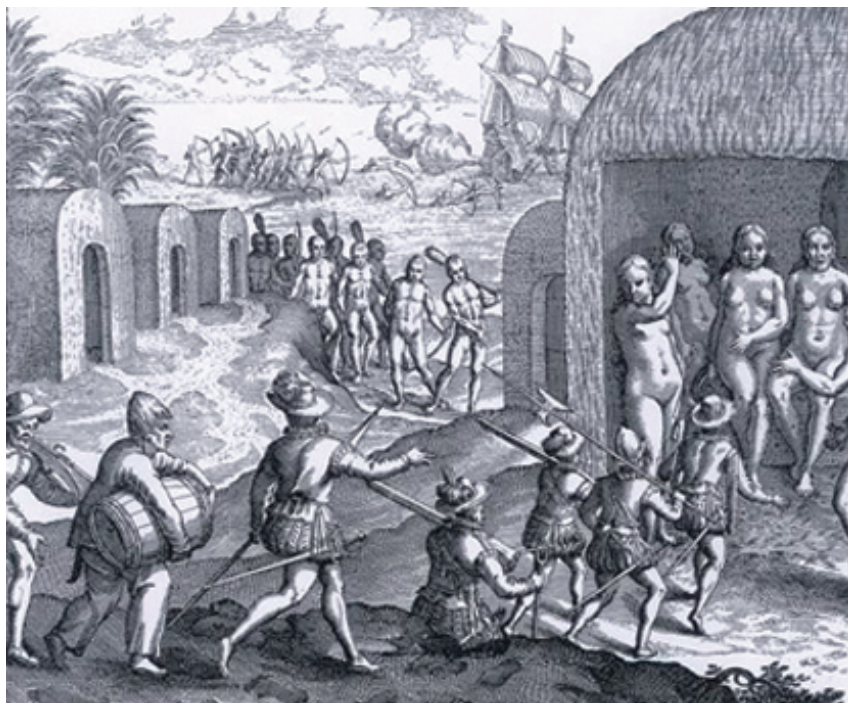
Figura 3. Theodor de Bry, América (1590-1634) . Lámina VI (Libro X, Parte 1ª, 1618: “De cómo son recibidos Amerigo Vespucci en una ínsula habitada por gigantes”. Madrid: Editorial Siruela.

como gigantes de fuerza descomunal, los españoles tenían que ser vistos como seres superiores a esa fuerza. En este sentido, queda claro que la incorporación del mito de los gigantes a la Historia buscaba acreditar el valor de la empresa. 89