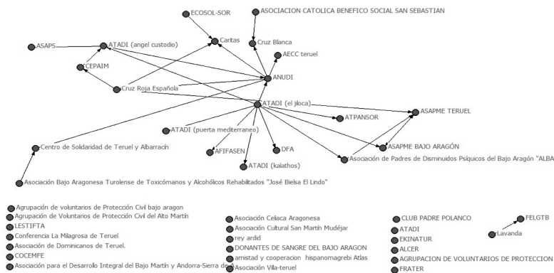
Figura 4. Red de relaciones entre entidades que se relacionan esporádicamente

A través del análisis de redes se modeló también la red de relaciones entre entidades que se relacionan esporádicamente. Cada actor está representado con un nodo (un círculo rojo en este caso), mientras que la flecha que sale de cada actor dirigiéndose a otro indica la relación que tiene de manera esporádica con esa entidad (ver Figura 4).